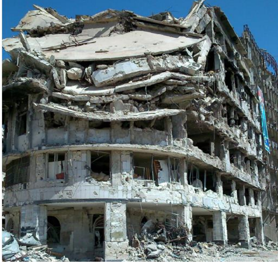
الشكل (٢) الأنهيارات الحاصلة في مبنى اتحاد عمال حمص .

نلاحظ من الصورة على الشكل (٢) وهي لمبنى اتحاد عمال حمص : انهيار بشكل كامل للبلاطات في الواجهة الجنوبية للطوابق (السادس ، الخامس ، الرابع ، والثالث )، الواجهة الشرقية والواجهة الغربية متصدعة بشكل جزئي ، يوجد بعض التصدعات والانهيارات في بعض العناصر (الأعمدة ، الجوائز ، والبلاطات ) في داخل البناء .